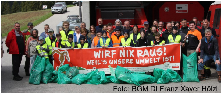
Alle Teilnehmer von heuer

geringe Menge mühevoll gesammelt wurde, muss leider festgestellt werden, dass einige wenige nach wie