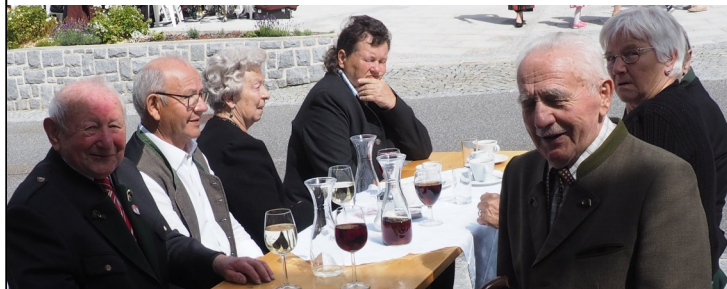
Koppi liebte die Geselligkeit

mit, wenn Not am Mann war. In der Pension half er als Busfahrer, Schulbusfahrer, Schankbursche etc. aus, wenn Franz gefragt wurde. In der wenigen Freizeit sang er sechs Jahrzehnte im Kirchenchor und war aktiver Musiker und Funktionär beim Musikverein. Der regelmäßige Kirchgänger Koppenberger war mit über 80 Jahren wohl der älteste Sternsinger Österreichs, da er Menschen in Not helfen wollte. Mit seiner Ziehharmonika spielte er bei Zusammenkünften für die Dorfgemeinschaft und auch im Altersheim für die betagten Menschen. Der gesellige Koppi war überall gerne gesehen, besuchte alle Veranstaltungen und arbeitete bis zuletzt in seinem geliebten Wald. So umtriebig, lustig und leutselig er in seinem erfüllten Leben war, so still und leise ist er im Schlaf gestorben. Ende Juli wurde er am Friedhof in seiner „neuen“ Heimatgemeinde begraben. Weitersfelden ist um einen liebenswürdigen und einzigartigen Menschen (ein Unikat, ein Unikum, ein wirkliches Original) ärmer geworden. Koppi wird uns allen sehr fehlen. OSR Hermann Mühlbacher hat das „filmreife“ Leben unter dem Titel „ VERTRIEBEN – Lebenserinnerungen eines Sudenteutschen “ niedergeschrieben. Das Heft kann man in der Gemeinde-Bibliothek Weitersfelden/ Abteilung Geschichtsarchiv ausleihen.