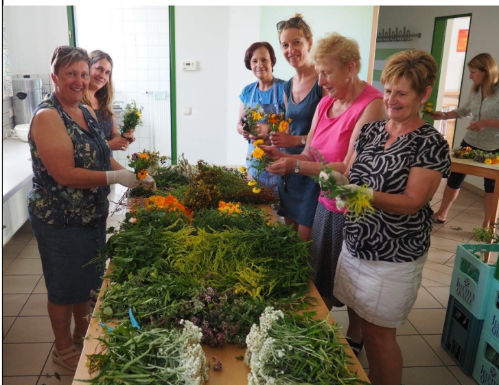
In den Tagen um den 15. August werden die Kräuter gesammelt und zu Buschen gebunden

In den Hochlagen der Mühlviertler Alm war um diese Zeit der Hochsommer vorbei und meistens konnte man sich auf einen schönen nebelfreien sogenannten „ Altweibersommer “ freuen. Früher durften ab dem 12. September die armen Leute das liegengebliebene Korn von den abgeernteten Feldern sammeln. Eher seltener wurde bei uns der „Frauendreißiger“ erst am 15. September „Maria Schmerzen“ (Mater Dolorosa) beendet.