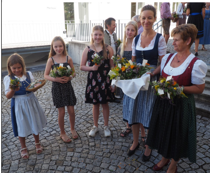
Nach dem Festgottesdienst werden die Kräuterbuschen am Kirchenplatz verteilt. Die eingenommen Spenden werden für den Kirchschnuck verwendet