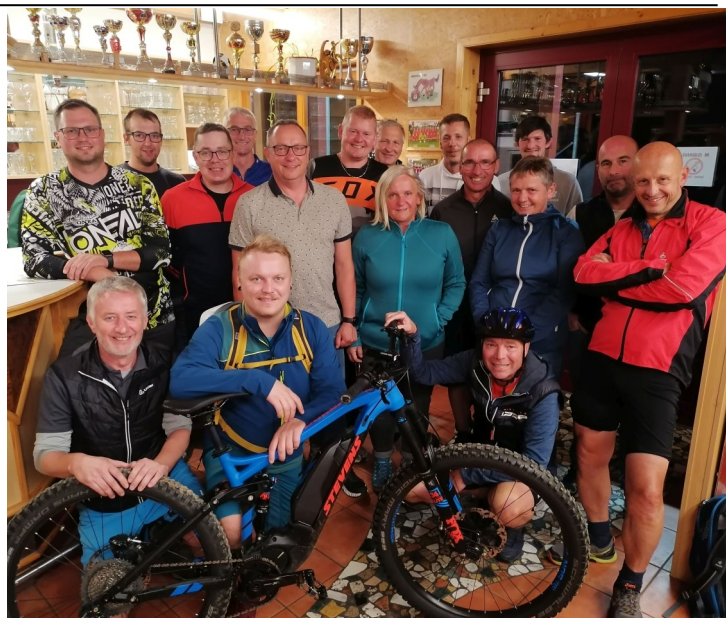
Bericht/Foto: Klaus Preining

In einer Rad-Whatsapp-Gruppe werden Infos gestreut und zu gemeinsamen Touren eingeladen. Natürlich hofft man auf weitere interessierte Biker bei der Sektion. Diese können sich gerne bei Sektionsleiter Peter Mühlbacher (0664/2324908) melden, wo sie dann weitere Infos erhalten.