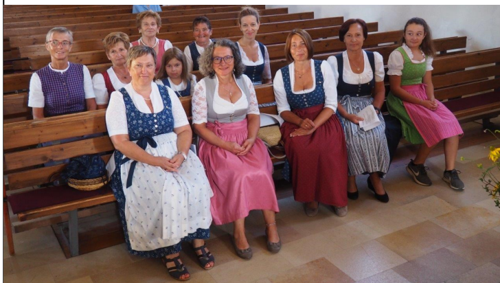
Zur Segnung der Kräuterbuschen und Wetterkerzen erschienen die Frauen im luftigen Sommerdirndl-Kleid

oder entsaftet, sodass auch im Winter die Früchte der Natur zur Verfügung standen. Die Wurzeln wurden nach alter Tradition erst im Herbst geerntet.