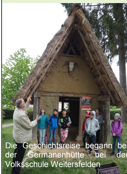
Die Geschichtsreise begann bei der Germanenhütte bei der Volksschule Weitersfelden

Die Pfarrkirche und Pfarre Weitersfelden wurde um 1300 als herrschaftliche Eigenkirche der Herrschaft Reichenstein errichtet. Um 1500 gab es bereits einen Marktrichter.